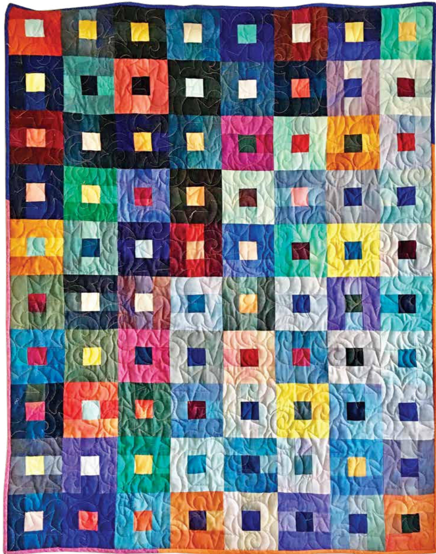
Pesukarhun pesät, 118,5 cm x 150,5 cm.