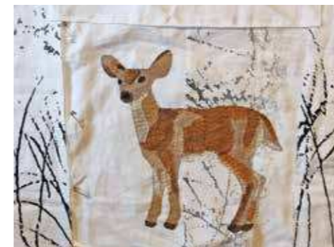
Talven sylissä, keskeneräinen. Tea Savola, Espoon kilta.

Ylälämpiön ysärit -työt ovat kooltaan 90 cm x 90 cm, mutta aihe ja sen käsittely oli täysin vapaa.