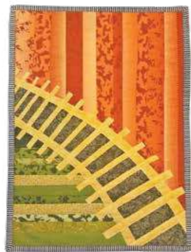
Keltainen rata. Raija Ekblom, Espoon kilta 2 Torstaitikkaajat