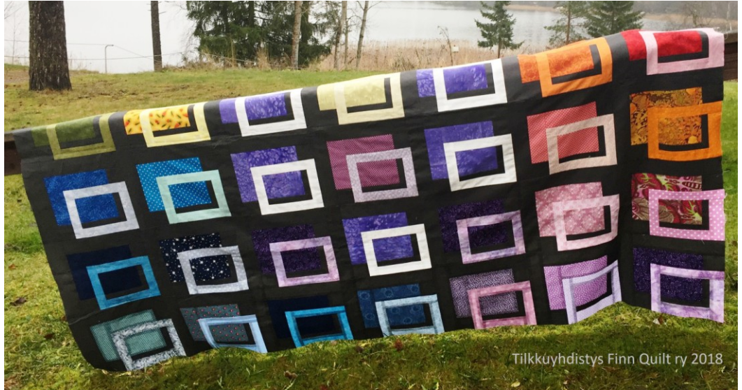
Tilkkuyhdistys Finn Quilt ry 2018