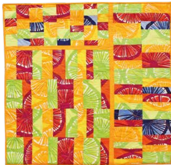
Pirjo Ihalainen: "Yli 100 Appelsiinia".