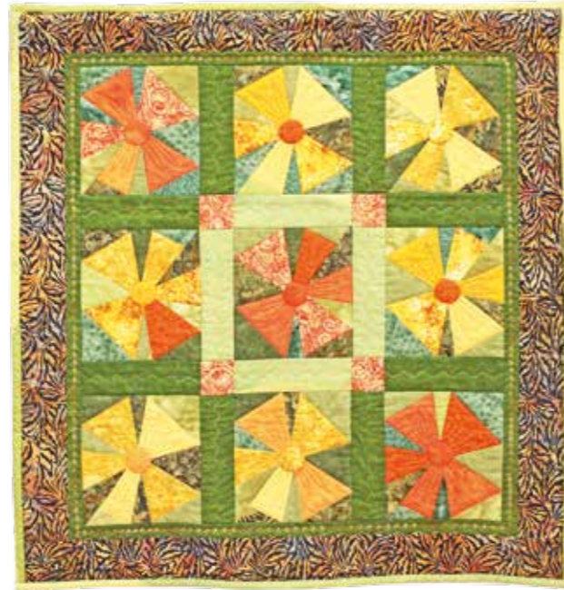
Terttu Lindqvist: Kehäkukat. Vasemmalla vehreät vaahterat.